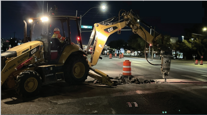
Night work near Greenway Road. Construction crews are installing electric utilities, which will power a future traffic signal.

* Este cambio de tráfico no cambia las rutas de desvío actuales de Sunset Road.